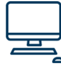
Периферия и аксесоари