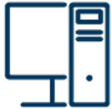
Компютри и компоненти