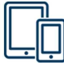
Смартфони и планшети